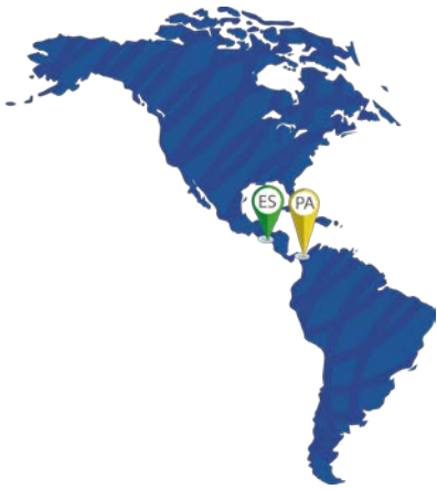
Primer mercado integrado centroamericano. El Salvador y Panamá como naciones pioneras.