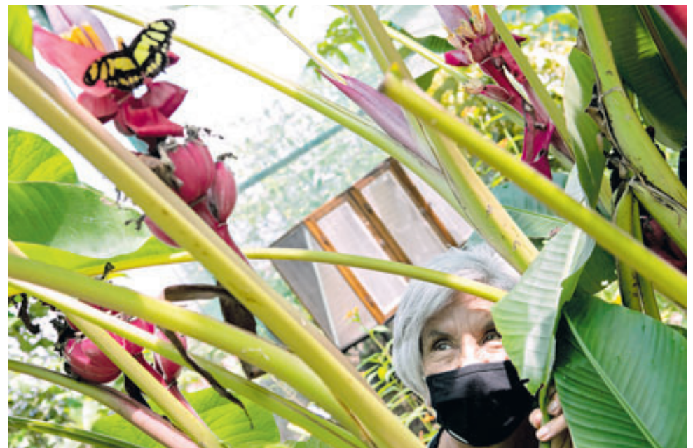
El turismo es una de las estrategias que se usará para lograr los objetivos de desarrollo.

Otra de las propuestas es impulsar un ecosistema de seis corredores catalizadores, que vinculen zonas claves, generen sinergias, mejoren la accesibilidad, generen oportunidades sociales y optimicen operaciones logísticas, mientras que al mismo tiempo se creen nuevos empleos sostenibles._EFE