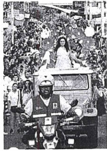
Santa Teresa de Ávila es la patrona a la que estarán venerando en Armenia.