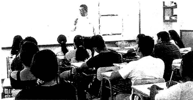
Los alumnos recibirán 12 horas semanales de inglés intensivo.